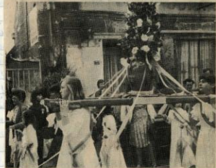
Thourotte était hier en lice à l'occasion de son bouquet provincial dont le déroulement a échauffé petits et grands. Nous reviendrons plus longuement sur cette magnifique manifestation dans une prochaine édition.