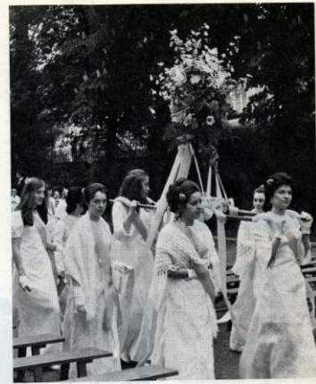
Les dameselles, d'honneur portant le Bouquet.