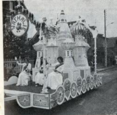
Les très beaux chars fleuris ont parcouru les rues de Margny-les-Compiègne sous les applaudissements des nombreux spectateurs.