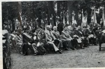
Les membres du Conseil Supérieur étaient tous présents au Bouquet de Margny-les-Compiègne.