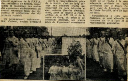
Les "vétérans" de l'Archerie à l'honneur

Après le rassemblement, place de la Mairie, c'est un long cortège aux couleurs variées qui traversera les rues décorées et sera couronné par une messe solennelle, pour se rendre à l'Église de la N.-D., où se fera la remise de l'Arc, au sein de la cérémonie solennelle, les jeunes filles de Vignemont rentraient